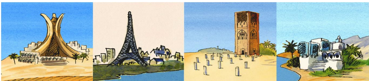
Alger, Paris, Rabat, Tunis (dessins de Jacques Ferrandez)